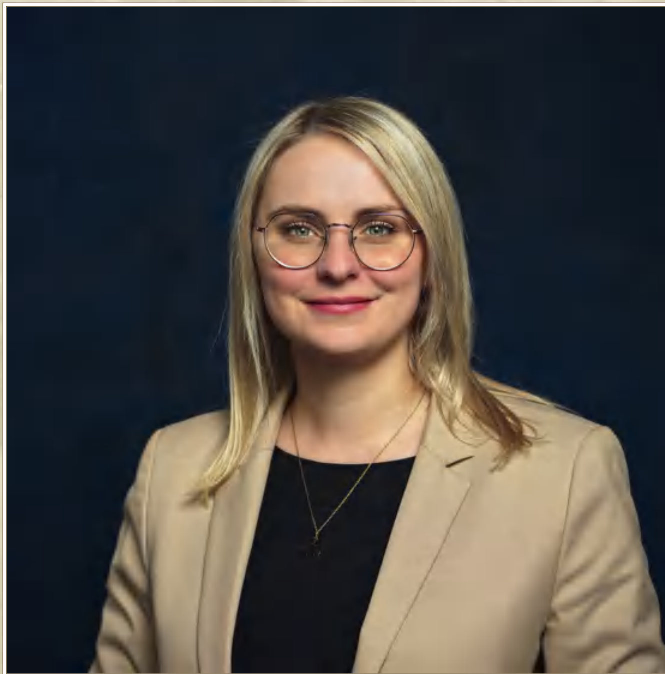
Frau Natalie Pawlik Beauftragte der Bundesregierung für Aussiedlerfragen und nationale Minderheiten, MdB