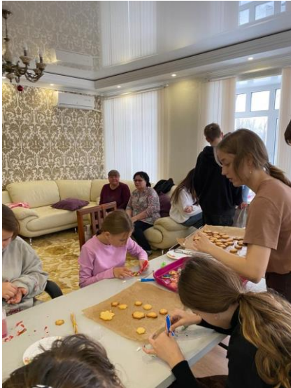
In aanloop naar Kerst werden er weer koekjes gebakken met de jongeren.

We ontvingen ontroerende foto's van de Advents- en Kerstperiode in Marx die we graag met u delen.